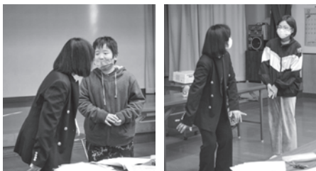
正面から目を見てゆっくり話しかけよう