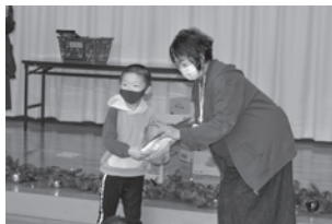
清水校区チャレンジキッズ

㈱セブン-イレブン・ジャパンより、生活困窮世帯への支援や地域福祉の推進に寄与する事業に役立てて欲しいとの趣意で「セブンプレミアム サクサクコーン 金のハンバーグ味」を300箱(1箱12袋入り)ご寄贈いただきました。