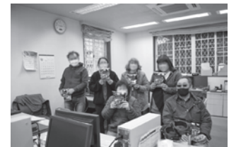
地域活動支援センターⅢ型 ITアトリエひこうせん