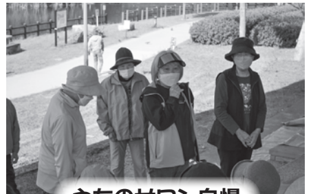
うちのサロン自慢

サロンを通じて色んな人が出会い、つながり、お互いが気にかける関係になることで、助け合いの輪やこの地域に住んで良かったという思いが広がっていきます。サロンとサロンの橋渡しや活動内容の企画など、いつでも地域支援コーディネーターへお気軽にご相談ください。