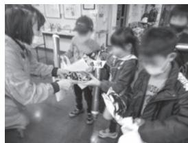
北小倉校区きたっ子