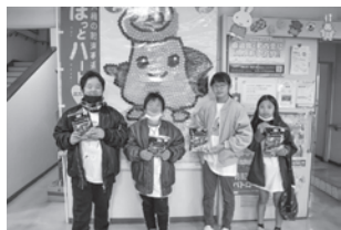
井堀校区ウェルクラブ

この善意の品は、小倉北区内の生活困窮世帯や子ども食堂、自立支援団体や校区社協等へ贈呈されました。