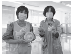
親子ふれあいルームに戻ってきたおもちゃたち

おもちゃ病院のボランティアの皆さんに壊れたおもちゃを直していただきました。修理が難しいものもありますが、長く大切に使用してほしいという想いが込められ、無事持ち主のもとへ帰ってきました。