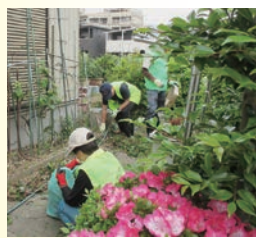
雑草の片づけ【富野校区】