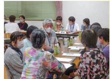
話し合いの場を大切にしています 【寿山校区】