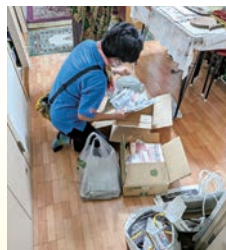
古紙の片づけと回収【西小倉校区】

「見守り」の際に発見した日常生活上の困りごとのうち簡易なもの臨時的なものなどは、地域住民で助け合います。