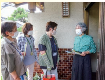
福祉協力員3名で訪問活動 【南小倉校区】

住民主体の地域福祉活動の要「ふれあいネットワーク活動」は、市内155の校(地)区社会福祉協議会が主体的に取り組む『見守り』・『話し合い』・『助け合い』の3つのしくみにより、高齢者や障害のある人、ひとり親で子育て中の世帯や生活上の困りごとを抱えた人などで、支援を必要とする人が地域で安心していつまでも暮らせるように、住民同士で支え合う活動です。