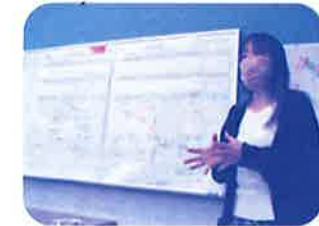
お助け隊の発足にむけてまずは視察と住民アンケート!(穴生地区)