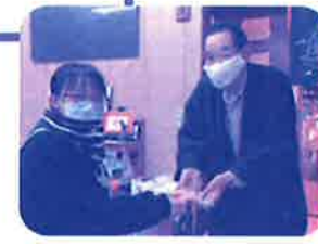
子ども達に福祉のボランティア活動を体験してもらっています(上津役校区)