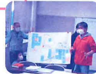
基本理念は「誰もが安心・安全に暮らせるまちづくり」に!(本城校区)