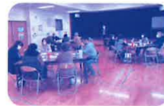
若い世代も一緒に参加できる活動を増やそう!(星ヶ丘校区)