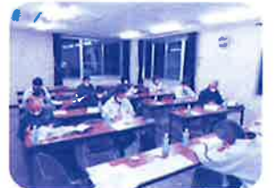
2ヶ月に1回、進捗状況を確認する推進委員会を開催しています(折尾西校区)