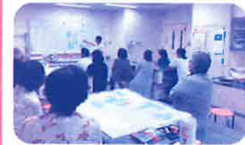
男性も参加しやすいサロンが欲しい!(中尾校区)

現在、地域の状況にあわせたオーダーメイドの計画づくり順次策定中!令和7年までに全校(地)区での策定を目指しています。