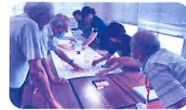
「防災」「生涯学習」「健康交流」「見守り」の4つのテーマに分類化!(木屋瀬校区)