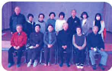
月に1回、皆の集まりやすい時間を調整してまずは楽しく!(浅川校区)