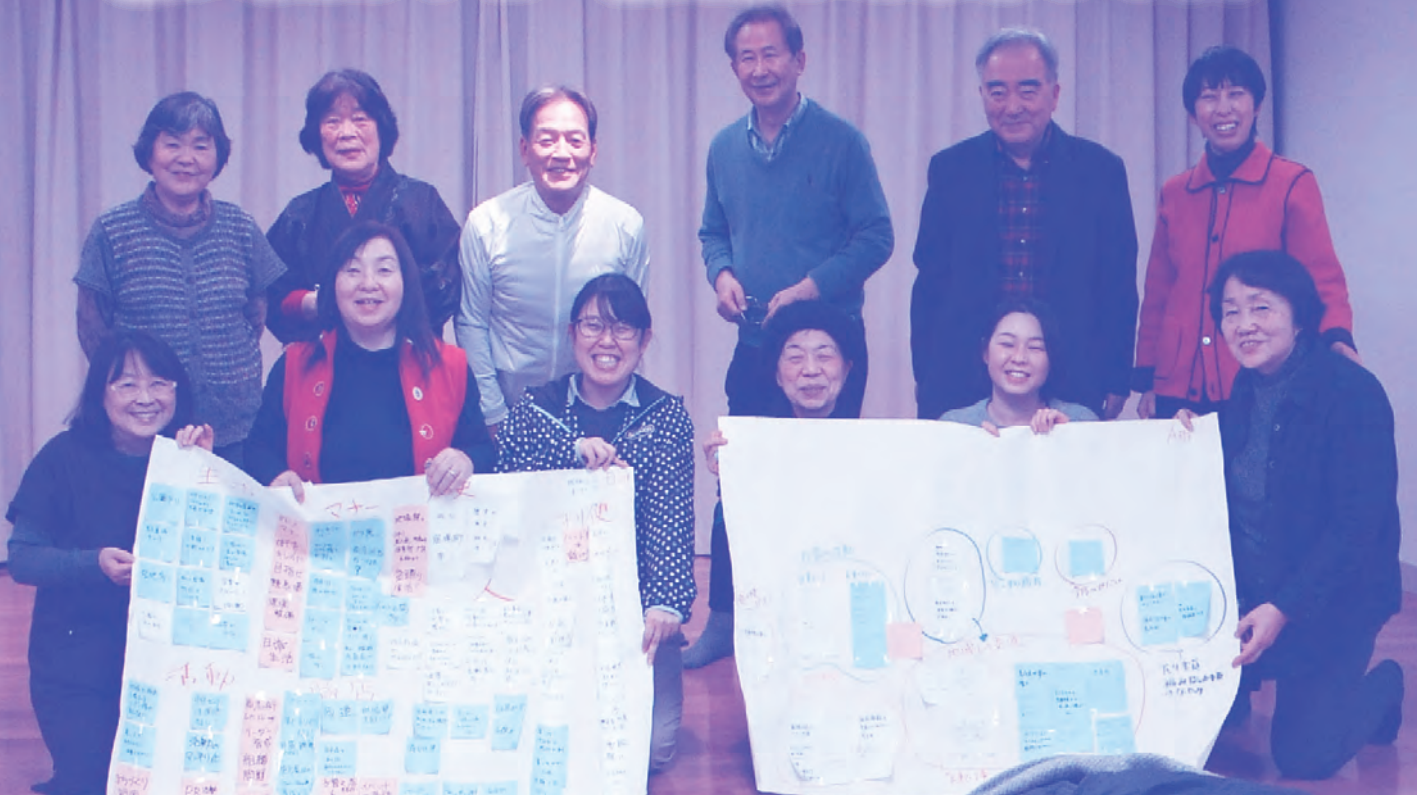
▲黒崎地区社協と策定委員の皆さん