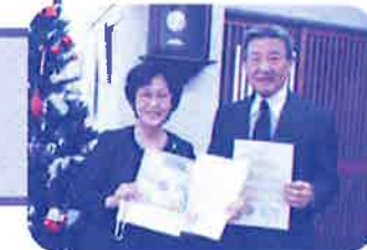
町内未加入者を対象とした災害時の連絡網づくりに取り組んでいます(陣山校区)