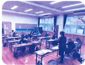
計画づくりの事前勉強会を3回実施しました(光貞校区)