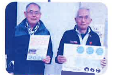
計画書は市政だよりと一緒に住民へ配布しました(熊西校区)