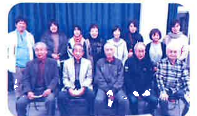
地区防災計画と整合性を図りながら災害に強いまちづくりに取り組めます(八枝校区)